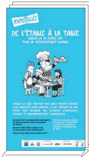
Expo-quiz® de 8 kakémonos