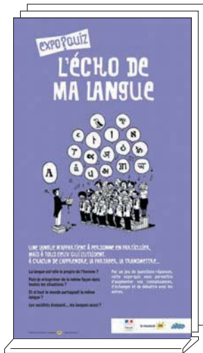
Expo-quiz® de 10 kakémonos