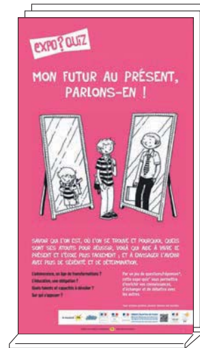
Expo-quiz® de 10 kakémonos