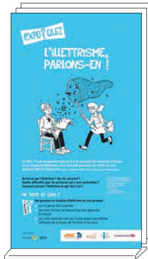
Expo-quiz® de 5 kakémonos