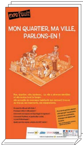
Expo-quiz® de 10 kakémonos